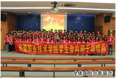
全体成员合影留念