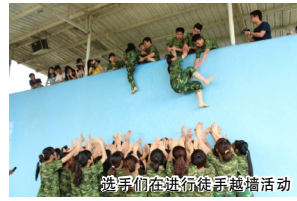
选手们在进行徒手越墙活动