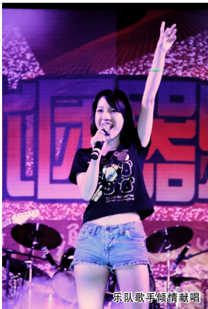
乐队歌手倾情献唱