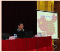
曾长秋教授在解读“中国梦”