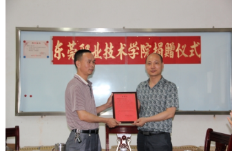
上蓝小学校长向我院赠送感谢信