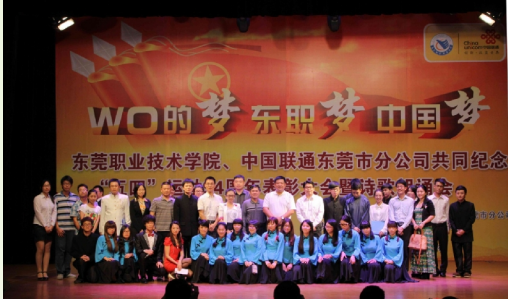
领导、嘉宾与演员们合影留念