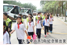
大手牵小手,向纪念馆出发