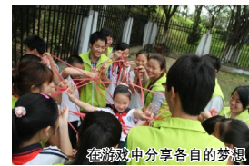
在游戏中分享各自的梦想