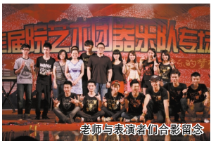
老师与表演者们合影留念