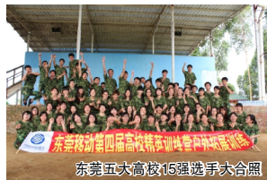
东莞五大高校15强选手大合照