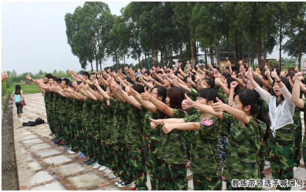
教练带领选手喊口号