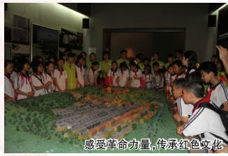
感受革命力量,传承红色文化