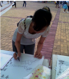
同学在海报上留下祝福