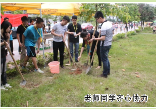
老师同学齐心协力