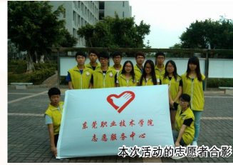
本次活动的志愿者合影