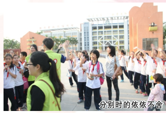
分别时的依依不舍